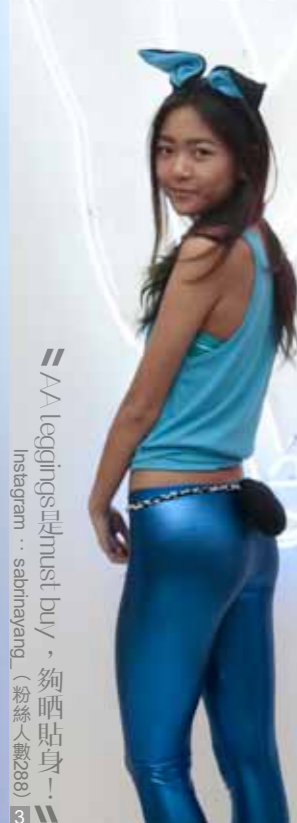
3 // AA leggings is a must buy, 夠晒貼身! Instagram: sabrinayang (粉絲人數288)

24年歷史、全球19個國家擁有過260間分店，美國連鎖店American Apparel (簡稱AA)曾短暫着陸過本地的連卡佛，於去年4月於金鐘LAB Concept再續，款式一致簡約，由貼身內衣到daily wear如tee、sweater一應俱全，更打正旗號多色多款！為迎接今月二十八至三十日的香港國際七人欖球賽，AA為大家選擇一系列觀看欖球賽服飾，前星期在LAB Concept舉行event，下午4時Happy Hour時段有加州Caliburger漢堡、好味detox飲品任食任飲，仲有國際學校美女同學示範Rugby 7s服，未開波先暖熨個場！撰文：陳家豪 美術：葉志雯