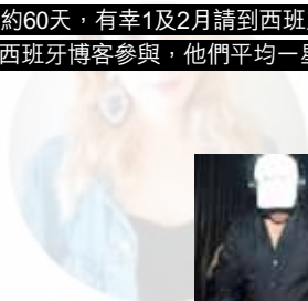
J FASHI JAPAN