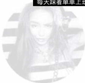
ponypong HONG KONG

最記得當時找來荷蘭雙子Viktor & Rolf別注shu uemura，兩位設計師好nice，唔會扮上等！