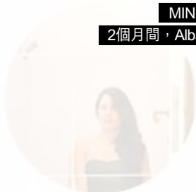
I love green inspiration ITALY

2個月間，Alba已找來30個西班牙博客參與，他們平均一星期更換個人網店的產品，似乎他們很喜愛MINIPOPUP的概念。