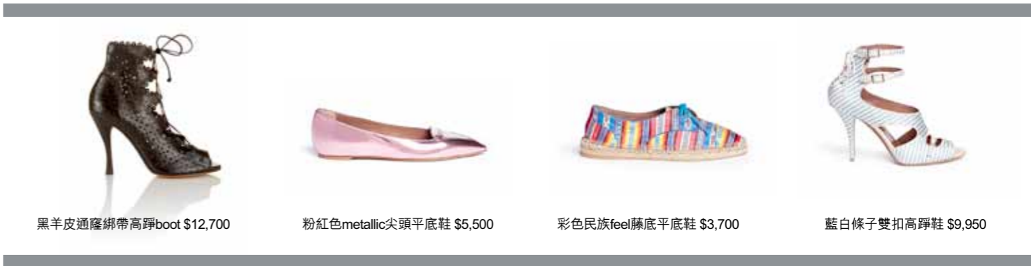
黑羊皮通窿綁帶高踭boot $12,700