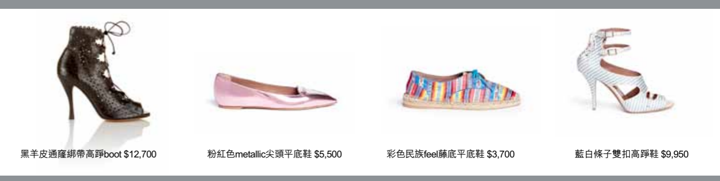
黑羊皮通窿綁帶高跟boot $12,700 粉紅色metallic尖頭平底鞋 $5,500 彩色民族feel藤底平底鞋 $3,700 藍白條子雙扣高跟鞋 $9,950