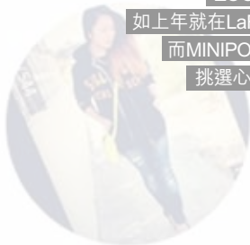
The Fashion Inbox HONG KONG

挑選心水貨物「放」入自己的版位，當有顧客從博客店子成功付款買貨，MINIPOPUP及博客亦有少許佣金。